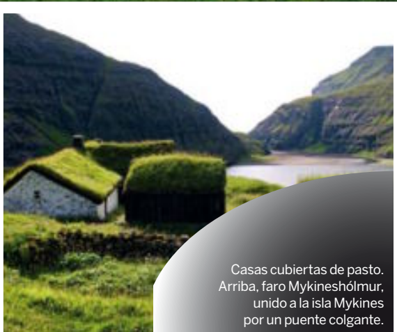
Casas cubiertas de pasto. Arriba, faro Mykineshólmur, unido a la isla Mykines por un puente colgante.