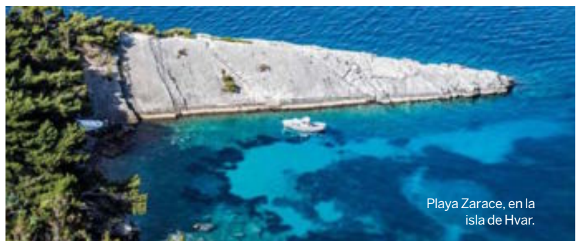
Playa Zarace, en la isla de Hvar.

La Ibiza de Croacia. Fácil de alcanzar desde Split, esta pequeña isla dálmata ofrece playas de roca y aguas cristalinas, bellas ciudades medievales, curiosos pueblos abandonados, paisajes plagados de viñedos y algo de lavanda, fiesta nocturna y lujo . Si te gusta el bullicio, quédate en Hvar, si prefieres tranquilidad, en Stari Grad. En ambos casos, los sobes (habitaciones en casas particulares) son una buena opción. tzhvar.hr